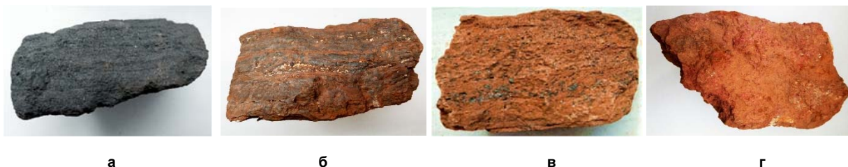
Рис. 1. Основные минеральные разновидности богатых руд входящих в состав отсева ДСФ: а – мартитовая ("синька"); б – дисперсногематит-мартитовая ("краско-синька"); в – мартит-дисперсногематитовая ("синько-краска"); г – каолинит-дисперсногематитовая ("краска").

Целью работы было уточнение существующих представлений о минеральном составе руд названных выше четырех минеральных разновидностей, обломки которых присутствуют в составе крупнозернистого отсева ДСФ.